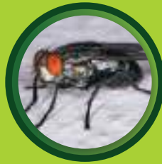
แมลงวันหลังลาย