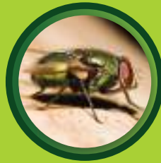
แมลงวันหัวเขียว