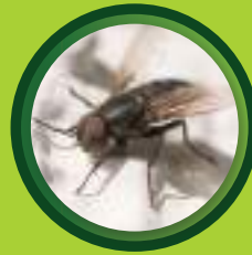
แมลงวันบ้านเล็ก